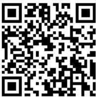
Perfil del Docente